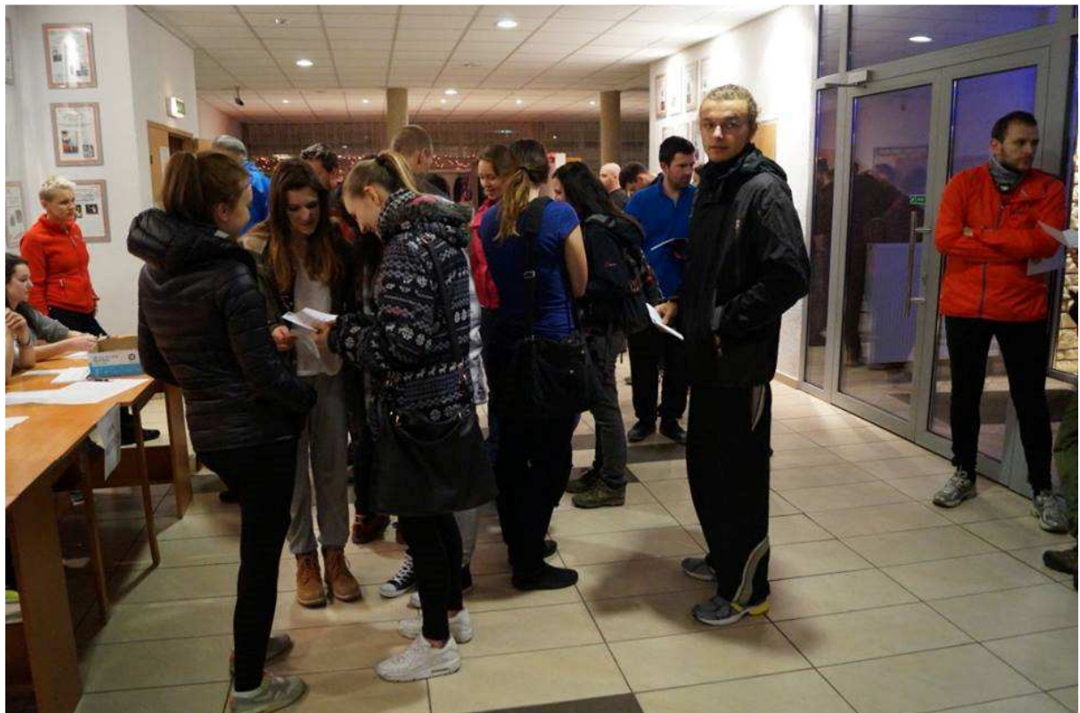
Z kartami kontrolnymi przed wyruszeniem