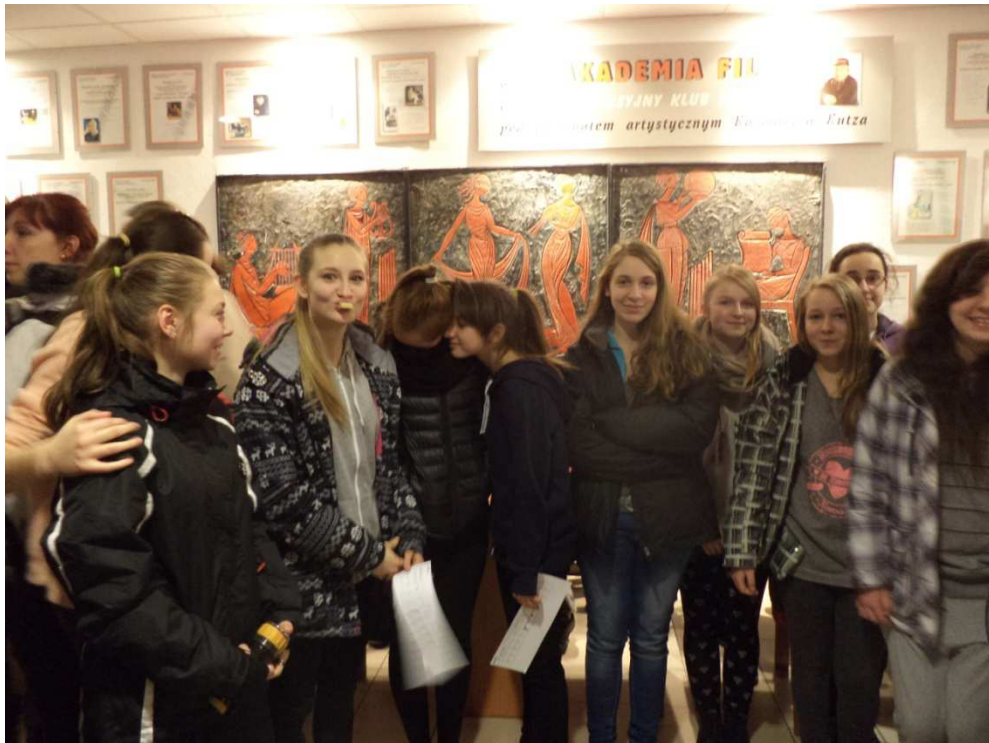
Zbiórka przed startem