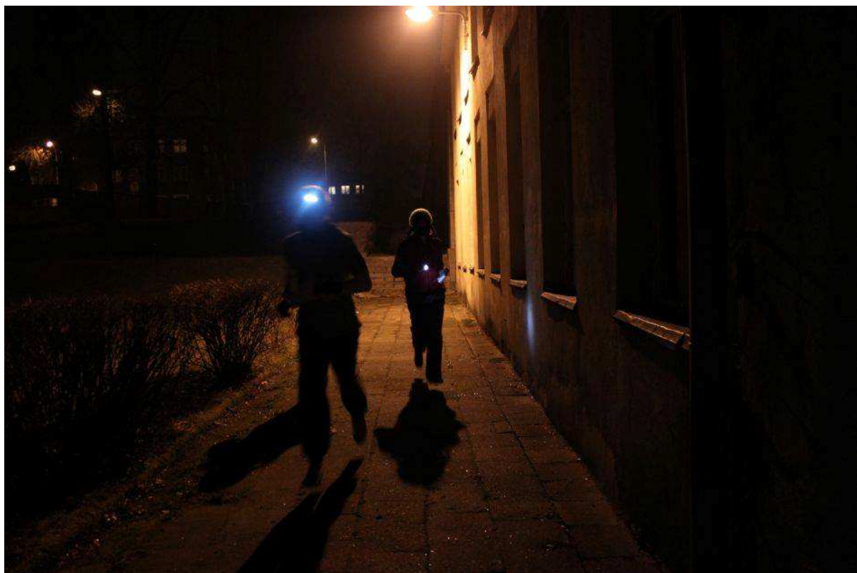
„Ciemno wszędzie, głucho wszędzie...” czyli w trasie